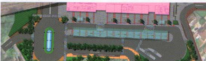
Plan de masse.