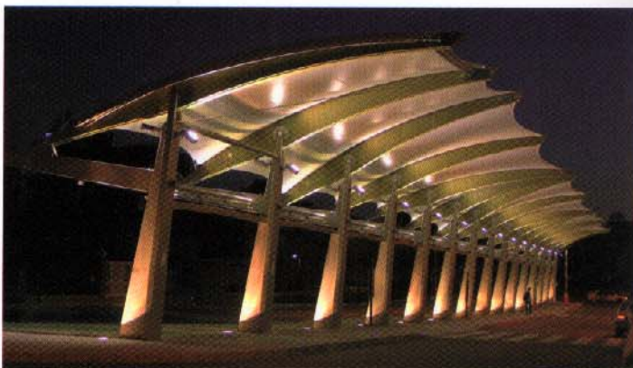
Vue nocturne sur l'auvent dans son ensemble.