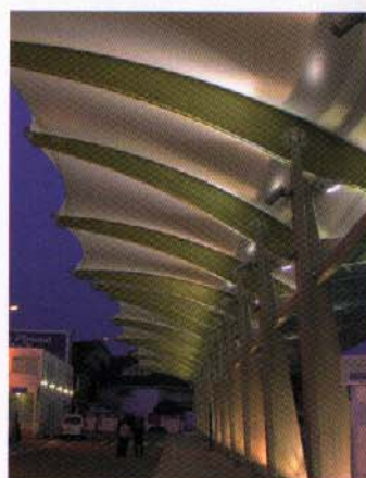
Vue sur l'auvent, de nuit.