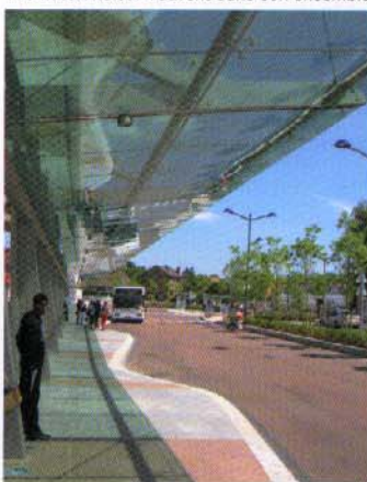
L'auvent en service.