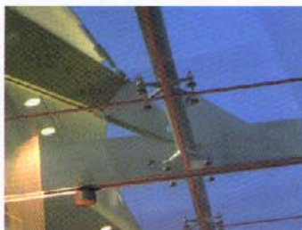
Détail sur la structure après pose du verre.

BET structure : groupe Alto (M. Malinowsky) / Entreprise : Viry